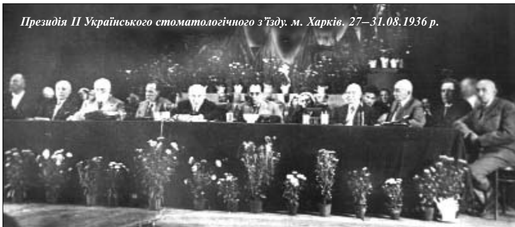
Президія II Українського стоматологічного з'їзду. м. Харків. 27–31.08.1936 р.

(За матеріалами книги «Українська медична стоматологічна академія. 1921–2001 рр.)