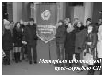
Матеріали підготовлені прес-службою СП

О 16.00 на площі були запалені свічки в лампадках, з яких виклали Герб України. Після чого учасники акції вшанували пам'ять загиблих хвилиною мовчання. Крім свічок, студенти та присутні залишали біля хреста горщики з зерном та хліб в пам'ять про загиблих від голоду.