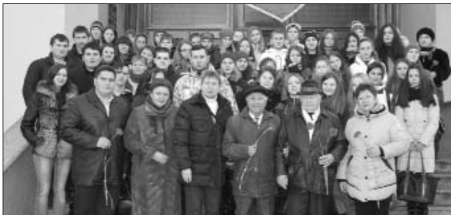
ляє у серця людей надію на перемогу наших Збройних сил у зоні АТО.